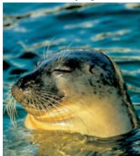
Voor- en tegenstanders zijn het erover eens dat opvang in ieder geval nodig is als de zeehond dreigt uit te sterven.

worden. Menselijk ingrijpen moet worden beperkt, omdat het interfereert met het respect voor wildheid. Kortom: het eco-ethisch perspectief is het uitgangspunt. Toch zijn er goede argumenten om binnen dat eco-ethisch kader aan opvang te doen, betogen de auteurs. Ten eerste stellen voorstanders van opvang dat dieren in nood domweg pech gehad hebben. Door ze te helpen tast je hun wildheid niet aan, maar biedt je ze juist een kans om dat waardevolle wilde leven te leiden. De auteurs spreken van het 'tweede-kans-argument'. Ten tweede: ongerept is de Waddenzee toch al niet. Toerisme, visserij,