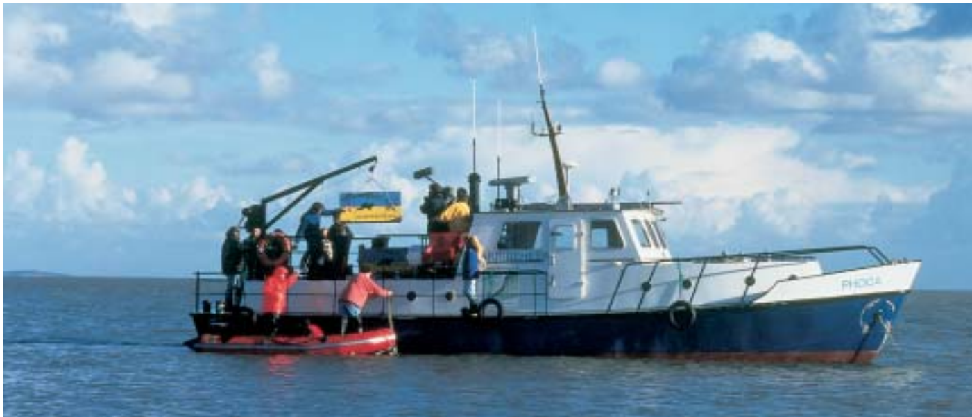
Midden op de Waddenzee worden de kooien met zeehonden overgezet in een rubberboot en naar een zandplaat gebracht.

dierethische blik hebben. Want hoewel de opvang dient om het lijden van