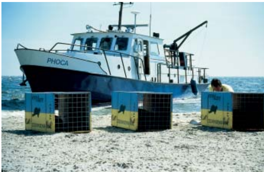
Nadat de zeehonden zijn hersteld worden ze verscheept om te worden vrijgelaten.

kwam op bij de discussie over de grote grazers in de Oostvaardersplassen.” Daar werden afstammelingen van gehouden dieren uitgezet om voortaan in het wild te leven. Toen er ’s winters dieren in moeilijkheden kwamen door voedselgebrek was de vraag: moet men die helpen of aan hun lot overlaten?” “Tot dan toe was de dierethiek altijd toegespitst op gehouden dieren, die van ons afhankelijk zijn. Wij zijn dan verantwoordelijk voor hun welbevinden. Nu kwam de gedachte op dat de zaken anders liggen voor wilde dieren, die in samenhang met hun leefomgeving functioneren. Juist hun wildheid – of, zoals in het geval van de Oostvaardersplassen, hun vermogen tot wildheid – verdient respect. Je kunt ook spreken van respect voor hun zelfstandigheid, autonomie, natuurlijkheid of eigenheid. Men ging inzien dat wilde dieren het recht hebben om in de natuur te worden geboren en in de natuur te sterven zonder onze bemoeienis.”